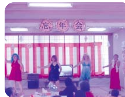
忘年会では、地域のボランティアの方々の出し物の他、デイサービス職員も体を張って利用者の方々を楽しませています。