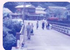
みんなで市田公民館へ歩いて通われています

95歳でも体力テストでは70代80代の方に負けない記録を出すお二人。地域のみなさんの目標にもなっています。