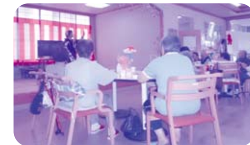
敬老会では地域の演芸ボランティアの方々が盛り上げてくださいます。