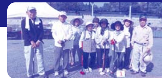
長寿会と千歳会のみなさん

この大会の成績上位者は「第18回さんさんクラブ宮崎スポーツ大会」へ、また成績上位5チームは「第9回美郷町高連グラウンド・ゴルフ親睦大会」に出場することになります。大会でのみなさんのご健闘を期待します。