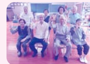
市田会のみなさん。火曜9時~行っています