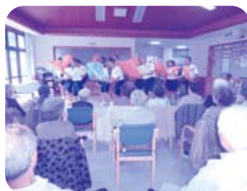
利用者との楽しい会話の様子 中学生がダンスを披露している様子