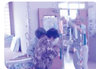
七夕の飾りつけをしている様子。

その他、季節に応じた様々なイベントを開催しています。今回は南郷デイサービスで行われているイベントを写真と共にいくつかご紹介します。