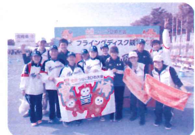
宮崎県選手集合写真