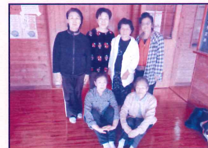
おせり会のみなさん