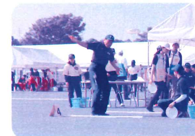
フライングディスク競技の様子