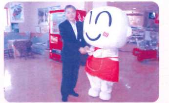
「南郷温泉山霧」での義援金贈呈式