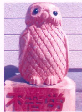
木彫りのフクロウ