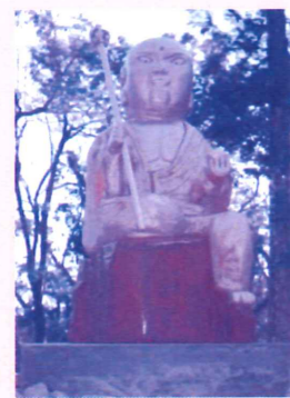
御開帳の時に見た地蔵を再現