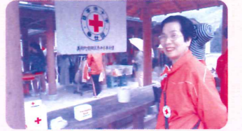
南郷赤十字奉仕団様による「森の駅きじの春まつり」街頭募金活動(4月23日)