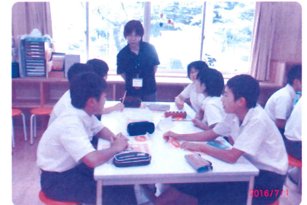
【認知症の方に出会った時にどのように対応するか、グループごとに話し合いをしました。】