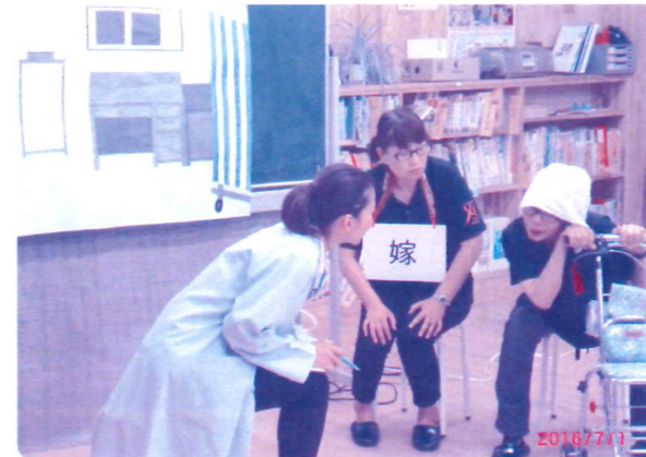
【認知症についてより理解して頂くために、「にわか一座」による劇を取り入れました。】

7月1日、美郷北学園にて認知症サポーター養成講座を開催し、7年生・8年生・9年生の27名が参加して下さいました。