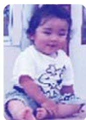
段ボールのベットに乗ってみたよ～

災害時を想定した、保護者への園児引き渡し訓練をしました。午前中は、ご飯を袋で炊いて食べたり、段ボールの簡易ベットに寝てみたりして災害時体験もしました。