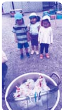
本当にごはんができるの(・・?)

災害時を想定した、保護者への園児引き渡し訓練をしました。午前中は、ご飯を袋で炊いて食べたり、段ボールの簡易ベットに寝てみたりして災害時体験もしました。