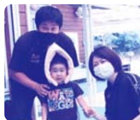
父母会長さん、ご苦労様です