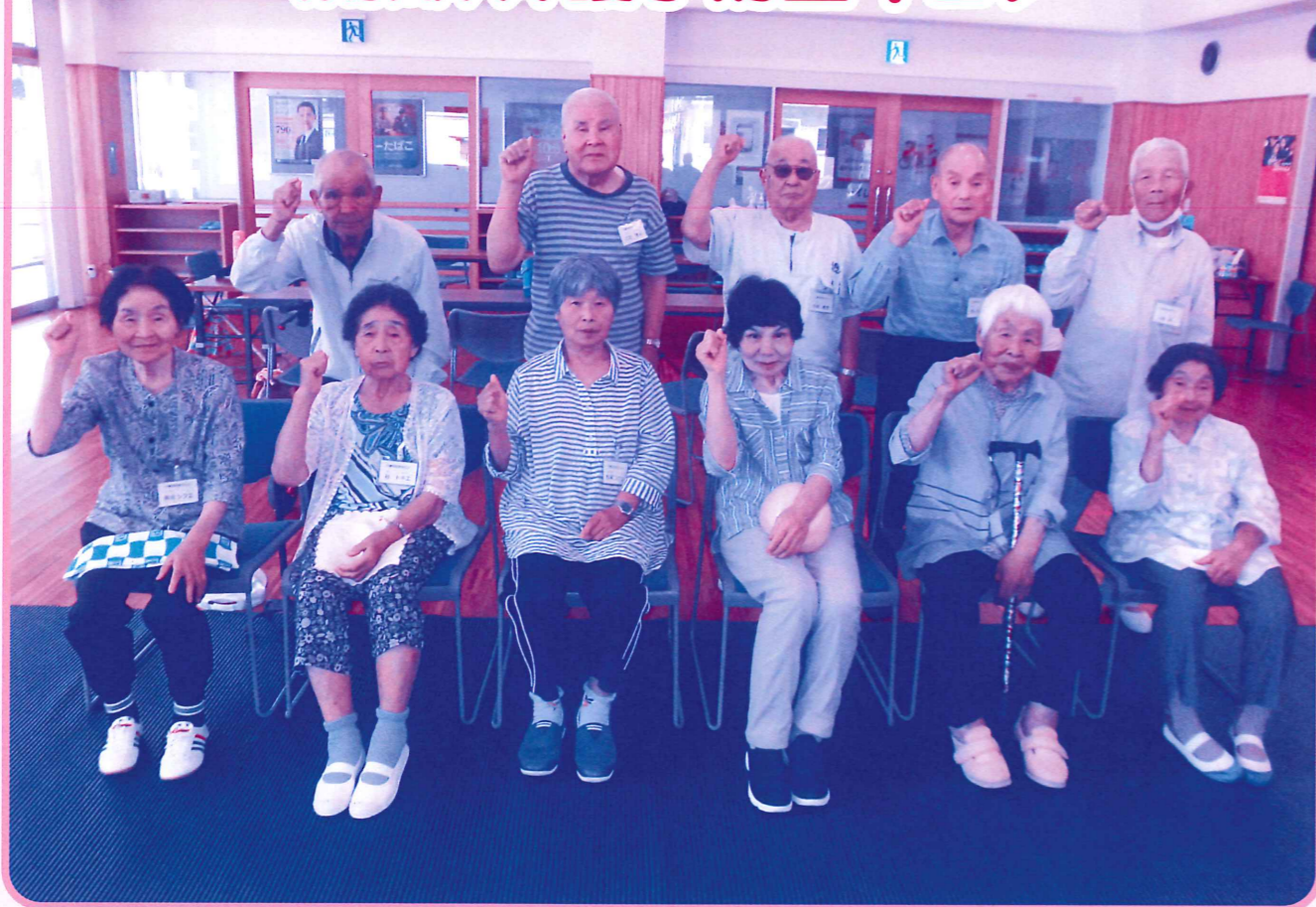
(※詳しくは2ページをご覧ください)