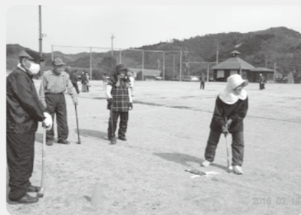
ホールインワン賞 9名 参加総人数 選手76名でした。