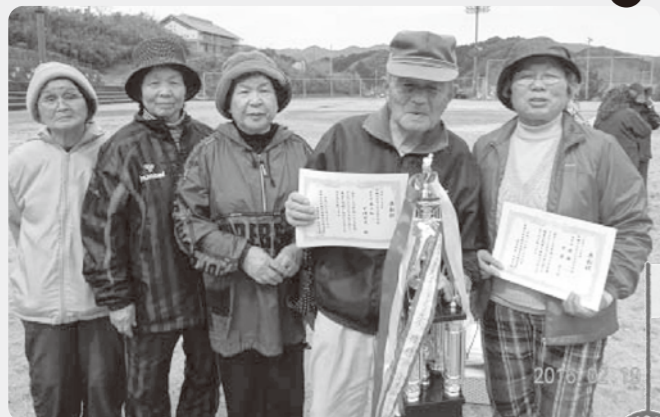
団体優勝の中原チーム